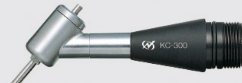
50° angle type