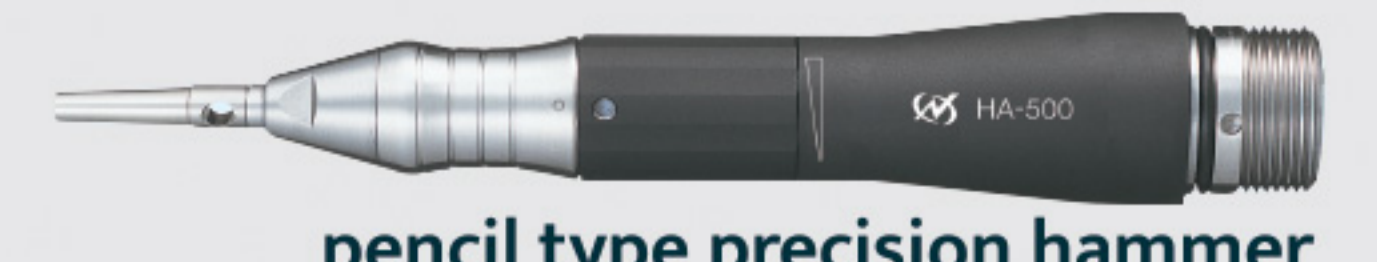
pencil type precision hammer