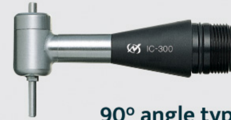
90° angle type