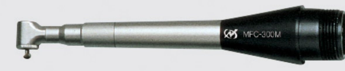
90° mini angle type