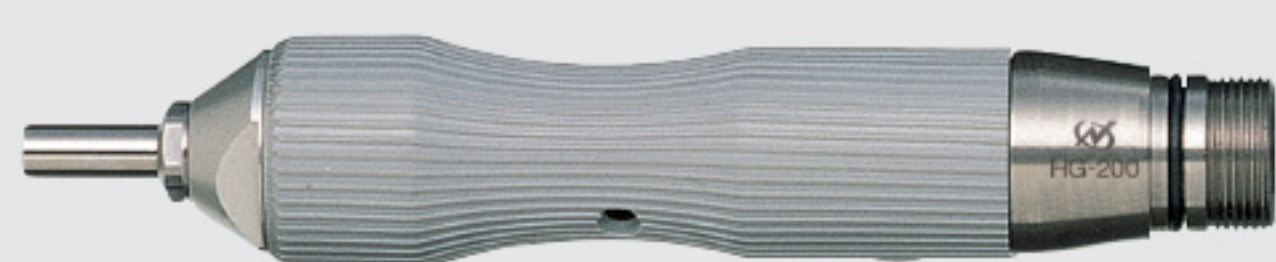
6 mm torque type