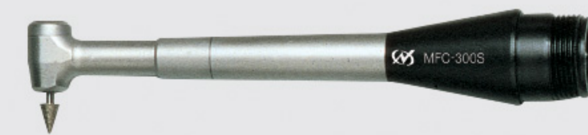
90° mini angle type