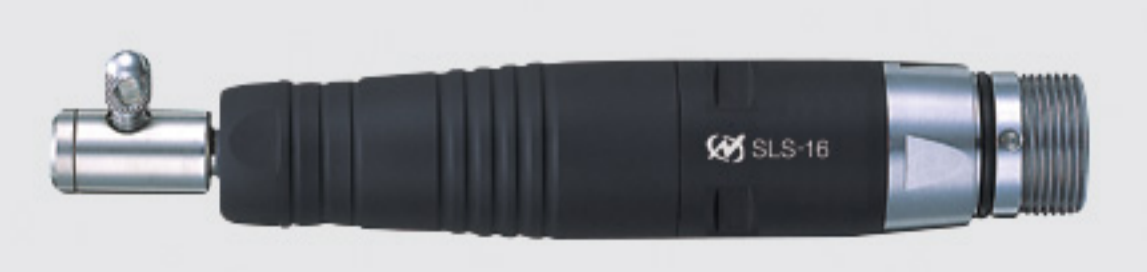
pencil type precision polisher (swing)