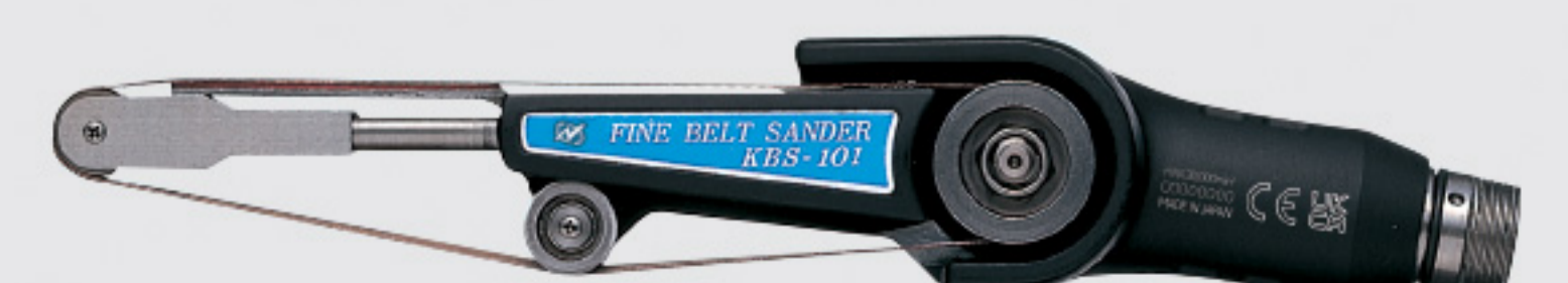
small handy belt sander