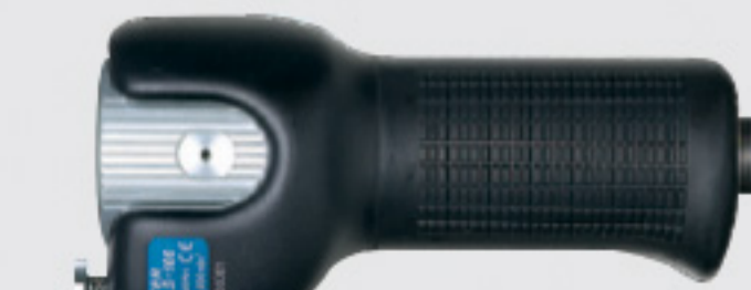
handy type polisher (reciprocating)