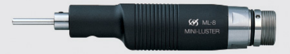
pencil type precision polisher (reciprocating)